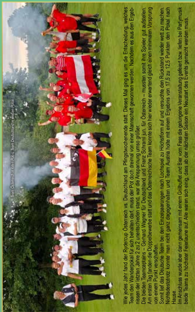
Team Österreich im roten Polo, Team Deutschland in weißen Polo's